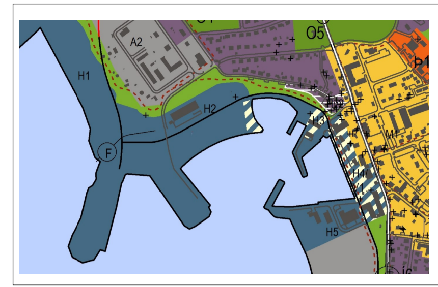
HLUTI ÚR AÐALSKIPULAGI NORÐUR-ÞINGS 2010 - 2030. BREYTT Í JANÚAR 2015. MKV. 1:10000